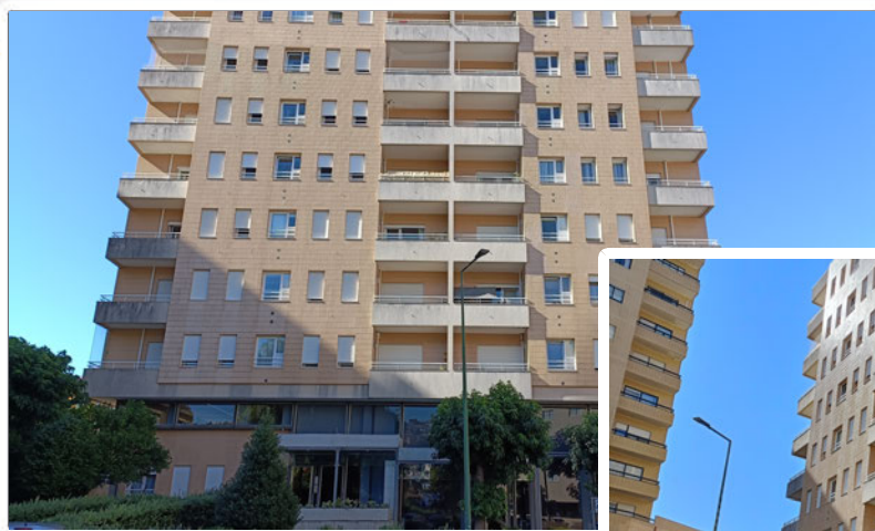
Imagem do Bem :