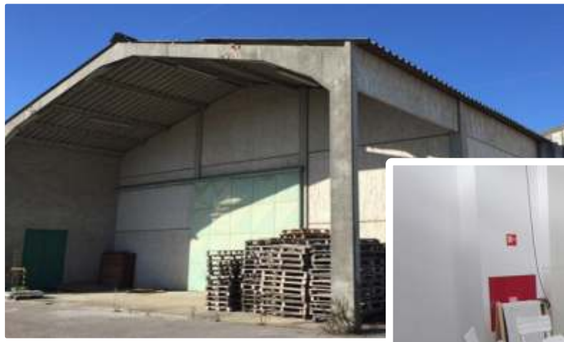
Imagem do Bem :