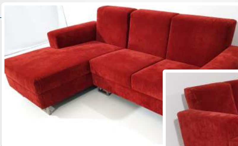
Imagem do Bem :