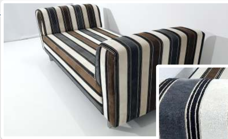
Imagem do Bem :