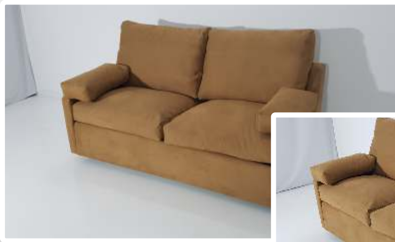
Imagem do Bem :