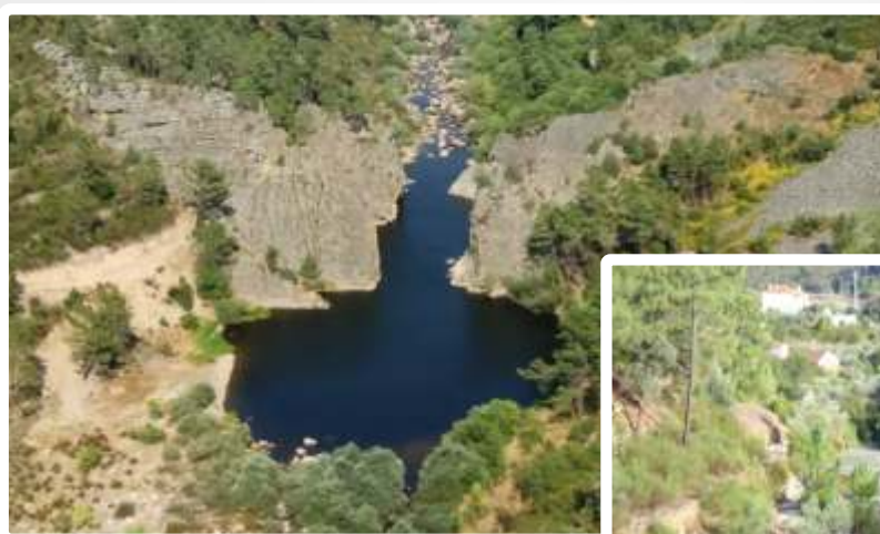
Imagem do Bem :