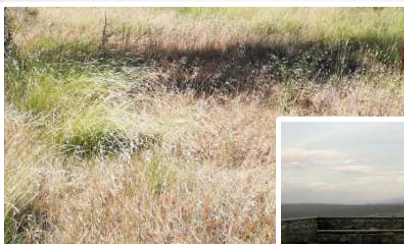
Imagem do Bem :