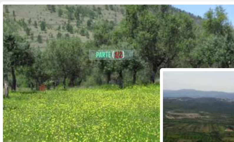
Imagem do Bem :