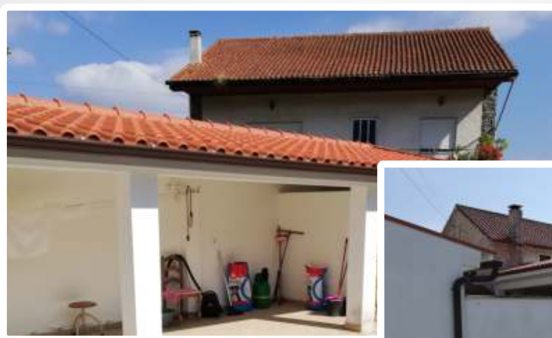
Imagem do Bem :