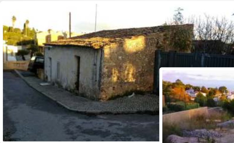
Imagem do Bem :