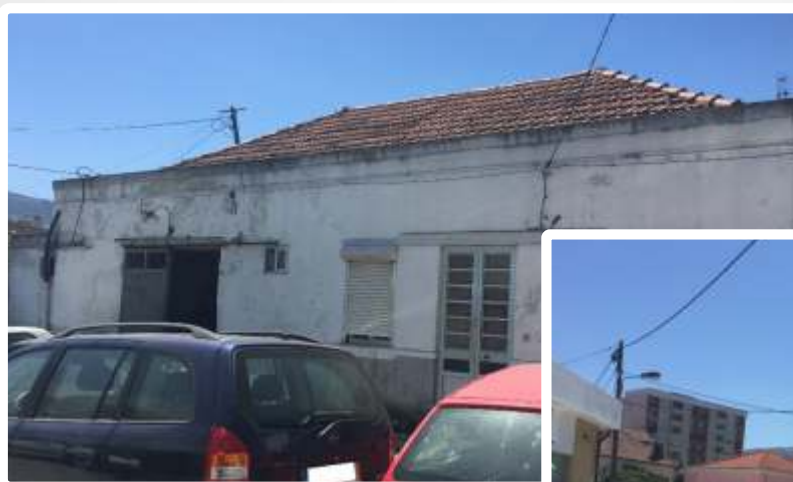
Imagem do Bem :