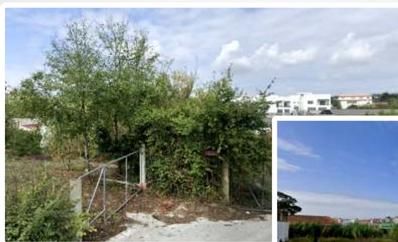
Imagem do Bem :