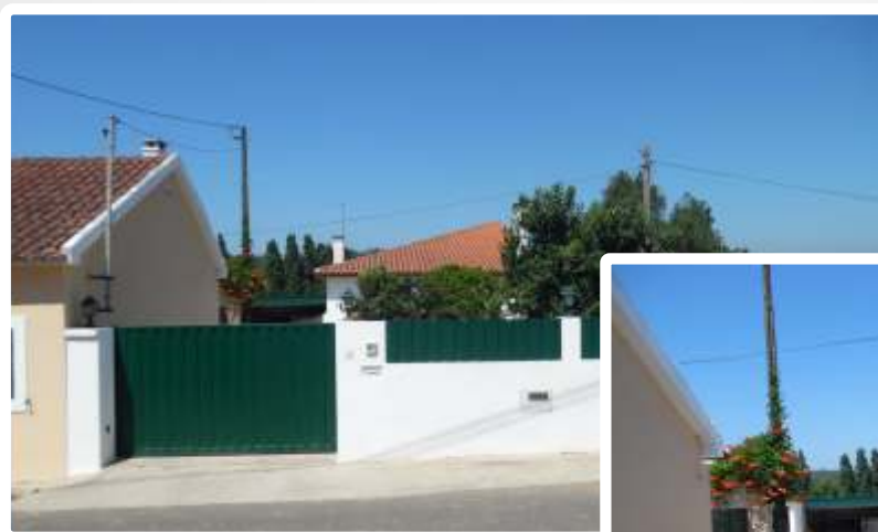
Imagem do Bem :