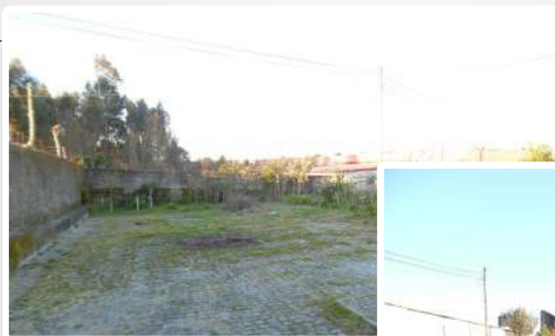
Imagem do Bem :