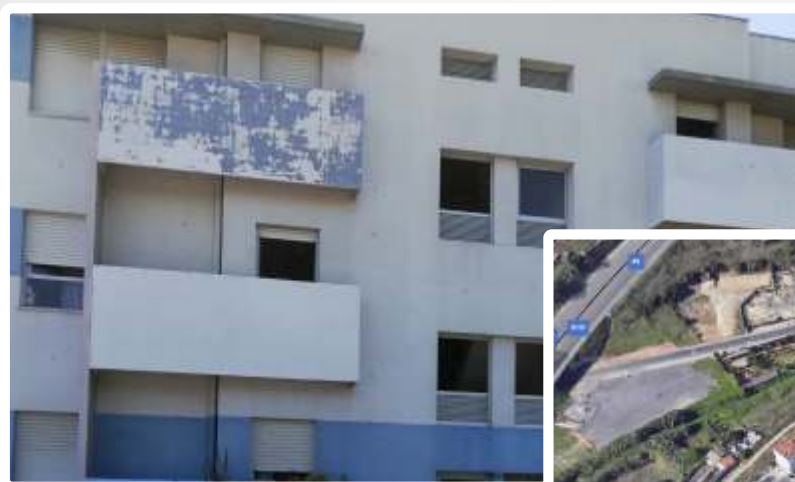
Imagem do Bem :