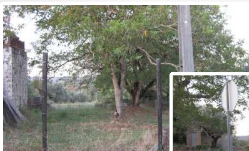
Imagem do Bem :