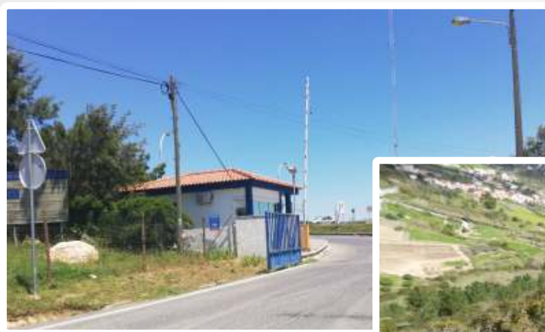
Imagem do Bem :