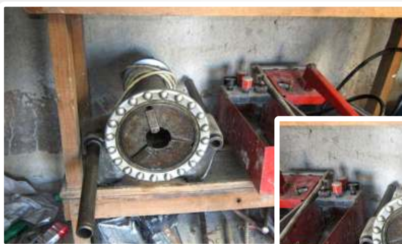
Imagem do Bem :