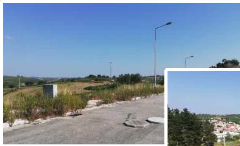
Imagem do Bem :