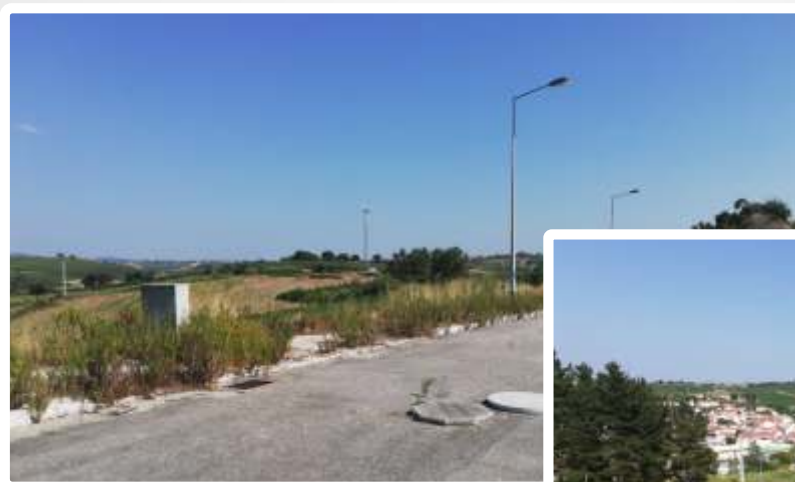
Imagem do Bem :